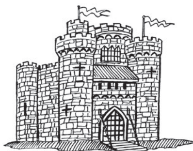
1 c _ st l _ _