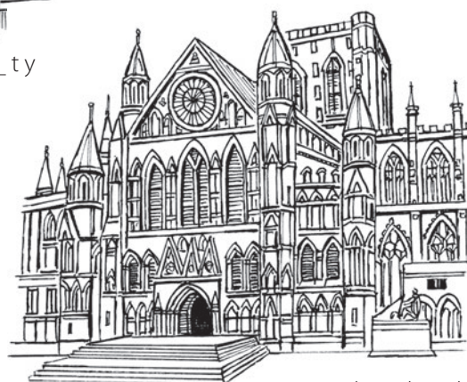
9 c _ th _ dr _ l