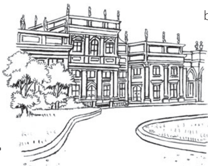
2 p _ l _ c _ _