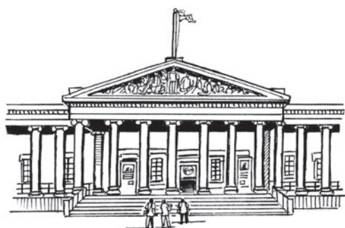
4 m _ s _ _ m