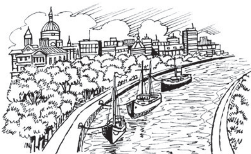
8 r _ v _ r