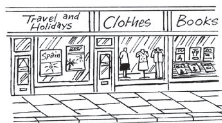
6 sh _ ps