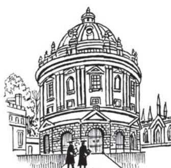
5 _ n _ v _ rs _ ty