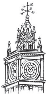
7 cl _ ck